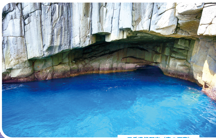
三重県熊野市（青の洞窟）